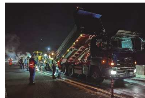
舗装補修工事の作業イメージ

安全・快適に高速道路をご利用いただくために必要な工事ですので、ご理解とご協力をお願いします。